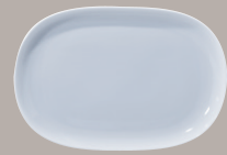
Ovale cod. 4885 cm 22 x 14 (8 3/4 x 5 1/2 )