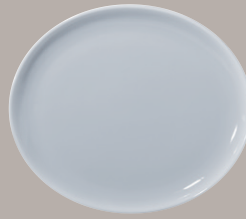
Piatto Unico cod. 16268 cm 29 x 25 (11 1/2 x 10)