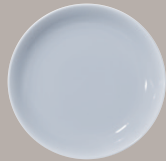
Piatto Fondo cod. 4498 ø cm 20 (7 3/4 )