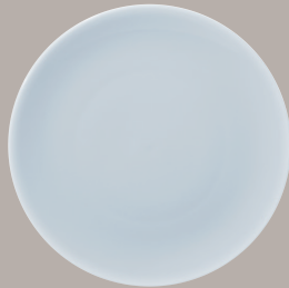
Piatto Piano cod. 4458 ø cm 30,6 (12)