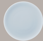
Piatto Piano cod. 17326 ø cm 17 (6)